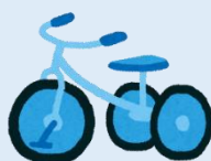
三輪車 トライク（自走できるもの）