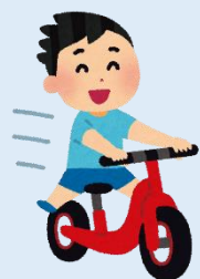
キックスケーター