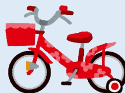
自転車（補助輪付き含む）