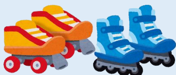
ローラースケート等