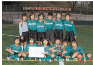
荻野サッカー少年団