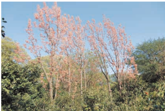
全く異なる種類の木です。

赤く見えるのは紅葉と同じくアントシアニンという色素のせいで、紫外線から若い葉を守っていると考えられています。椿の森にあり、中国語では香椿と書きますが、日本の椿とは