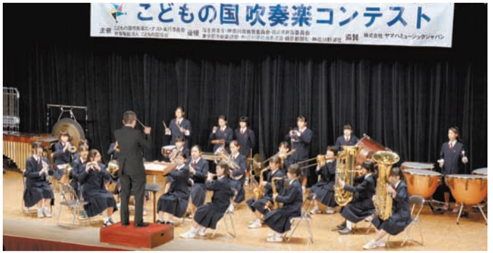
特別賞を受賞した羽村第二中学校の演奏風景

第32回こどもの国吹奏楽コンテストが10月20日(日)、皇太子記念館で開催され、神奈川県と東京都の中学校24校が参加しました。最高賞の特別賞は「バンドのための民話」を演奏した羽村市立羽村第二中学校が受賞しました。 協賛の株式会社ヤマハミュージックジャパンから明るく、楽しく、元気な演奏をした団体に贈られるさわやか賞は、「乱世の神威 幸村」を演奏した川崎市立塚越中学校が獲得しました。 同日中央広場で予定していた青空コンサートは雨天のため中止しました。 また、入口と会場の間を歩いた楽器を運んだために、楽器が