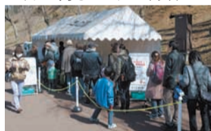
ホットミルク配布

15日(日)～3月2日(日)までの土日 梅まつり 梅林では約650本の梅が見頃。