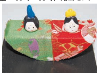
ゆらゆらおひなさま

◇わくわく焼き物体験 午前の部は10時30分まで、午後の部は13時まで受け付け、児童センター。