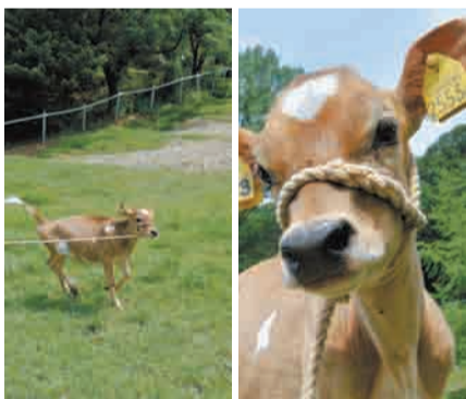
企画・監修:リアル宝探し【タカラッシュ!】

さて、モッチちゃん初めてのお散歩の日。頭酪をつけて通路に出ると、モッチちゃんはいつもと違う景色を見て楽しくなったのか、急に走り出しました。飼育員も一緒に走ると、