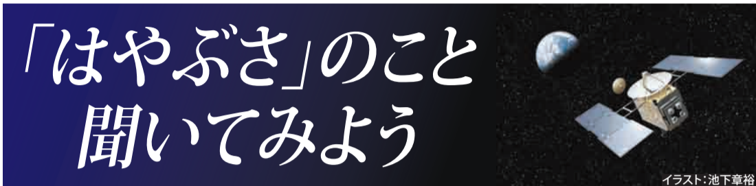
イラスト:池下章裕

天皇、皇后両陛下は侍従を通して「昨年に続いての知らせに接し残念ですが、園の皆さんが長きにわたり、よくお世話をしてくださいました。ありがとうございました。ご苦労さまでした」と三園長に伝えてこられました。 陛下からお預かりしていたのは2頭で、もう1頭のファルーチョは昨年8月に死にました。1978年、アルゼンチンのビデラ大統領が来日し、皇太子殿下(現在の天皇陛下)と接見したときに、3人のお子様にもポニーをプレゼントすると約束。2頭は79年11月に届き、こどもの国で飼育してきました。