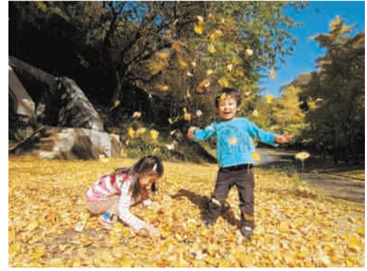
昨年秋のグランプリ作品