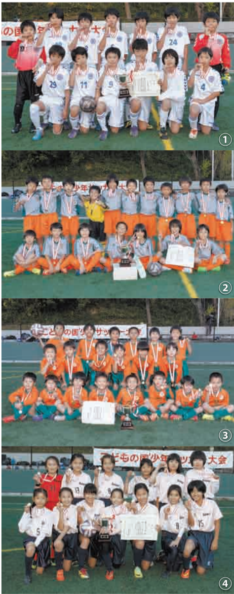
① 川崎FC (川崎) ② 相模原FC (相模原) ③ 厚木FC (厚木) ④ 大和FC (大和)