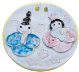
壁掛けのおひなさま

ひな祭りには少し早いですが手作りでお楽しみのおひなさまを作ってみてはいかがですか。児童センター工作室では1月25日(日)にわくわく焼き物体験「壁掛けのおひなさまづくり」を開きます。