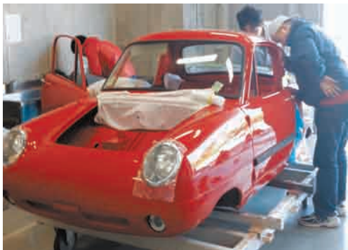
ダットサン・ベビー

作業をしています。解体し、使える部品は磨いたり、塗装し直したりしました。欠けている部品は、方々を探しまわり、なければ手作りです。タイヤは日本に見当たらず、台湾から取り寄せました。すでにボディの板金塗装は終わり、当時の美しい赤色に輝いています。現在は最後の組み立て作業にあたっています。3月に完成予定です。お披露目の日程が決まりましたら、改めてご報告します。ご期待ください。