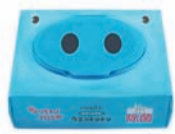
アルコール配合 無香料