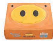
ノンアルコール オレンジの香り