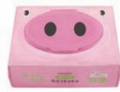
ノンアルコール 無香料