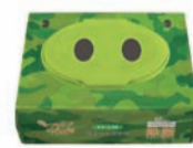
ノンアルコール ゼラニウムの香り