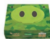
ノンアルコール ゼラニウムの香り