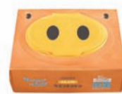
ノンアルコール オレンジの香り