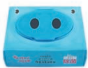
アルコール配合 無香料