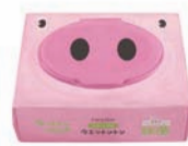
ノンアルコール 無香料