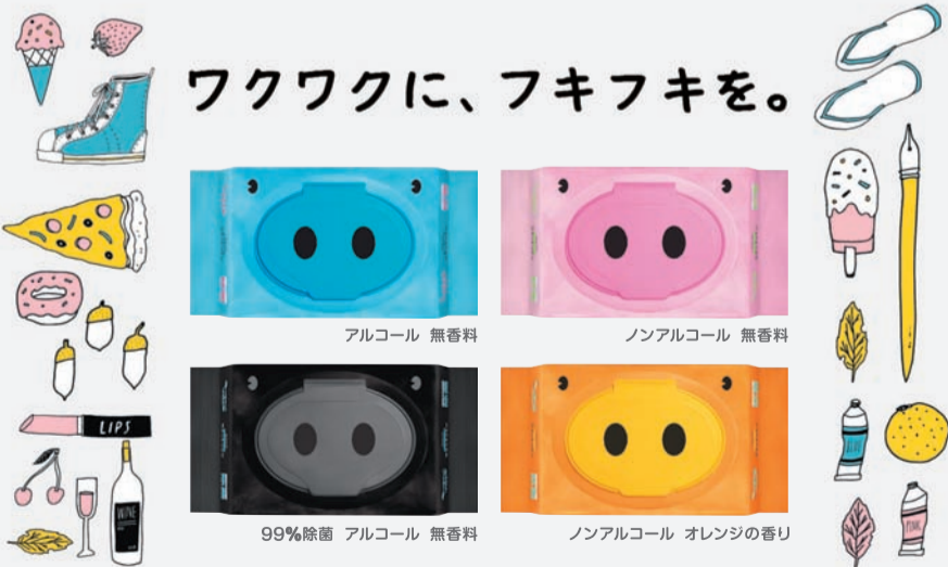
アルコール 無香料