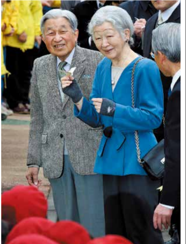
紙飛行機を受け取り、笑みがこぼれる両陛下

期間中、子どもたちは「さくらのかさぐる」工作や、自然スタンプピンゴを楽しみました。児童センターでは、「羊をつくろう」もあり、連日満員でした。