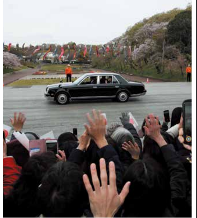
車でお着きになり、来園者に車中からお手をふって応える両陛下

販売。安さだけではなく、めずらしい品種もあり、たいへん好評でした。初日の午前中に購入した愛好家が午後にも訪れ、「あれほどあったのに」とビックリしていたほどです。