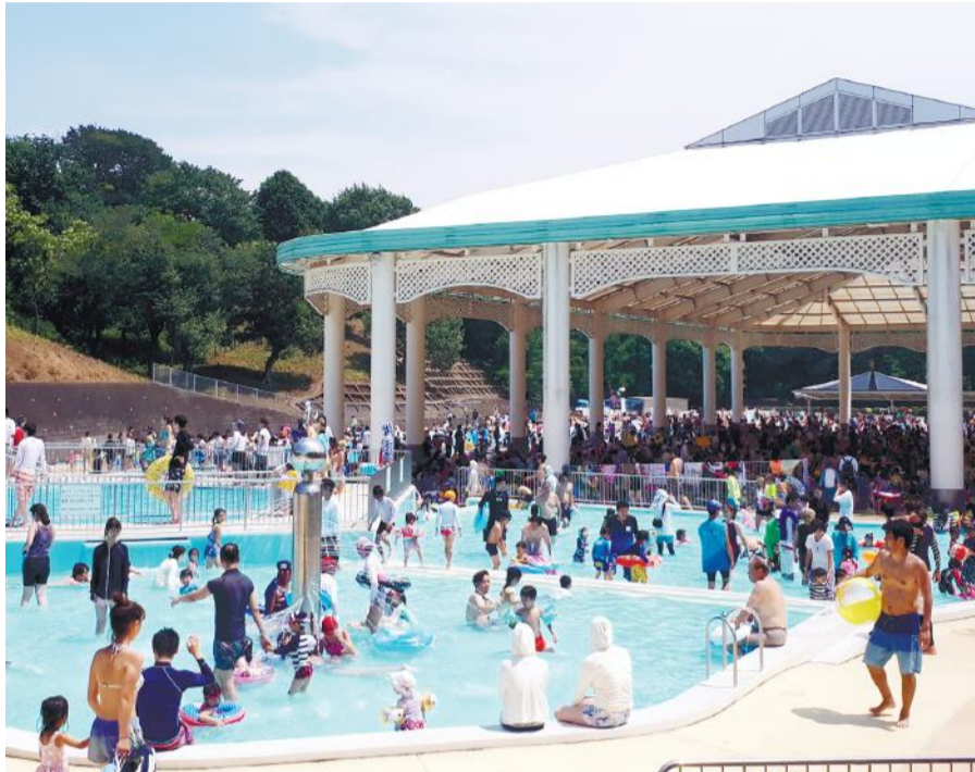
どなたでも楽しめるいろいろな水深のプールと、日进行て休憩できる大屋根