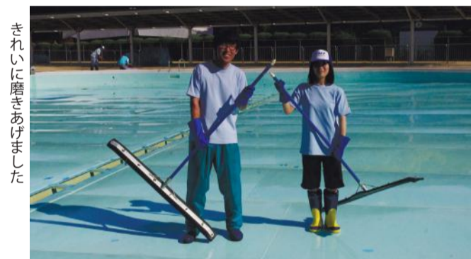
きれいに磨きあげました

でも落葉などが入り込んでしまいます。ですから、オープン前の準備は、まずプールの清掃から始まります。今年も6月のある日、こどもの国の職員総出で7つのプールをピカピカに磨き上げました。プールの槽内はもちろんのこと、排水溝、プールサイド、休憩スペース、更衣室、トイレなどなど、みなさまがご利用になるすべての場所を、衛生第一できれいに仕上げました。安心して遊びに来てください。 同じように、安全第一も万全です。せっかくの楽しいプール遊びで何かあってはいけません。そのために毎年、プール担