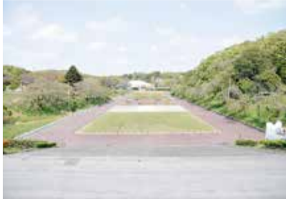
とある日曜日、誰もいない中央広場