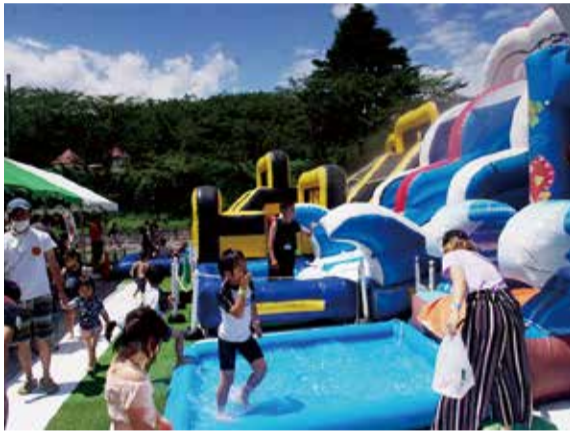
やっぱり夏は水あそび！

こどもの国ニュースをご愛読の皆さま、当ニュースは新型コロナウイルスの影響でしばらくの間休刊しましたが、5カ月振りに皆様のもとへお届けすることができました。年明けからじわじわと広がってきた新型コロナウイルスは、皆さまの日々の生活にも大きな影響を与え続けていることと思います。こどもの国も同様で、長期にわたる休園、各種イベントやプールの中止、感染防止対策の徹底など、これまでに経験したことのない数カ月間でした。現在は、色々な対策を講じながら元気に開園しています。皆さまもぜひ遊びに来てください。 世の中で日増しに新型コロナウイルスに対する危機感が大きくなっていったこの数カ月、こどもの国でも情報が不足する中で、対策を考える必要に迫られました。多くのお客さまにご来園いただき楽しんでいただく施設ですから感染が起きてはいけません。2月に、まずはいくつかの遊具、屋内イベントや多数のお客さまが集う屋外イベントなどを中止しました。その後、こどもの国が一番華やかになる桜の季節、多くのお客さまのご来園が見込まれる土日祝を休園することとなりました。 4月に入つてすぐ、緊急事態宣言が出たことを受け、5月末までの約2カ月間の休園になりました。この間、再開後のお客さまの安心・安全のためにすべきことを職員一同で行いました。その一つとして、発券前でお並びいただく際に間隔を空けていただくための足形がありました。園内の牧場の動物をイメージしたものにしました(人の足形もあるようです。ご来園の際に見てくださいね)。 長い休園を経て6月から平日のみで再開しました。新型コロナウイルスが終息した訳ではありませんので慎重に。消毒やマスク、うがいや手洗い、密集や密接を避けていただくことをお願いする放送やポスターで注意喚起を図ります。 7月からは土日祝も開園することとなりましたが、いくつかの遊具やイベントは中止を続けました。最も大きかったのはプールの中止でした。例年、夏休みの期間に合わせて7つのプールと4本のスライダーで楽しんでいただけていました。お客さまからも「プールは営業しますか?」というお問い合わせをたくさんいただきました。そこで、猛暑の中で水遊びを楽しんでいただくためのアトラクションを導入しました。こどもたちはプールの代わりにいっぱい遊んでくれました。 その後は遊具やイベントを徐々に再開しています。この先の新型コロナウイルスの状況が気になりますが、安心・安全を第一に、皆さまのお越しをお待ちしています。最後に、「コロナにまけるな」との力強いメッセージを描いてくれた君へ。「ありがとう、頑張ります!」 今下期は隔月発行です 平素よりこどもの国ニュースをご愛読いただき、また全国の教育委員会、教育事務所におかれましては、関係各所へご転送いただきありがとうございます。 当ニュースは、本年5月号を記念すべき第600号として発行いたしました後、コロナ禍の影響により6月号、7・8月合併号、9月号を休刊いたしました。創刊以来55年の間、東日本大震災の直後に1号だけ休刊した以外は欠かさず発行して参りましたが、これまでの状況下で編集作業等にも支障を来し、やむなく3号を休刊させていただきました。ご愛読いただいている方には大変なご迷惑をお掛けいたしましたことを心よりお詫び申し上げます。 今般、諸々の環境を整え、今号より復刊させていただきます。今下期は隔月の発行(10月号、12月号、2021年2月号)の予定です。今後ともご愛読、ご転送をお願い申し上げます。 社会福祉法人こどもの国協会