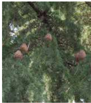
枝につくマツボックリ